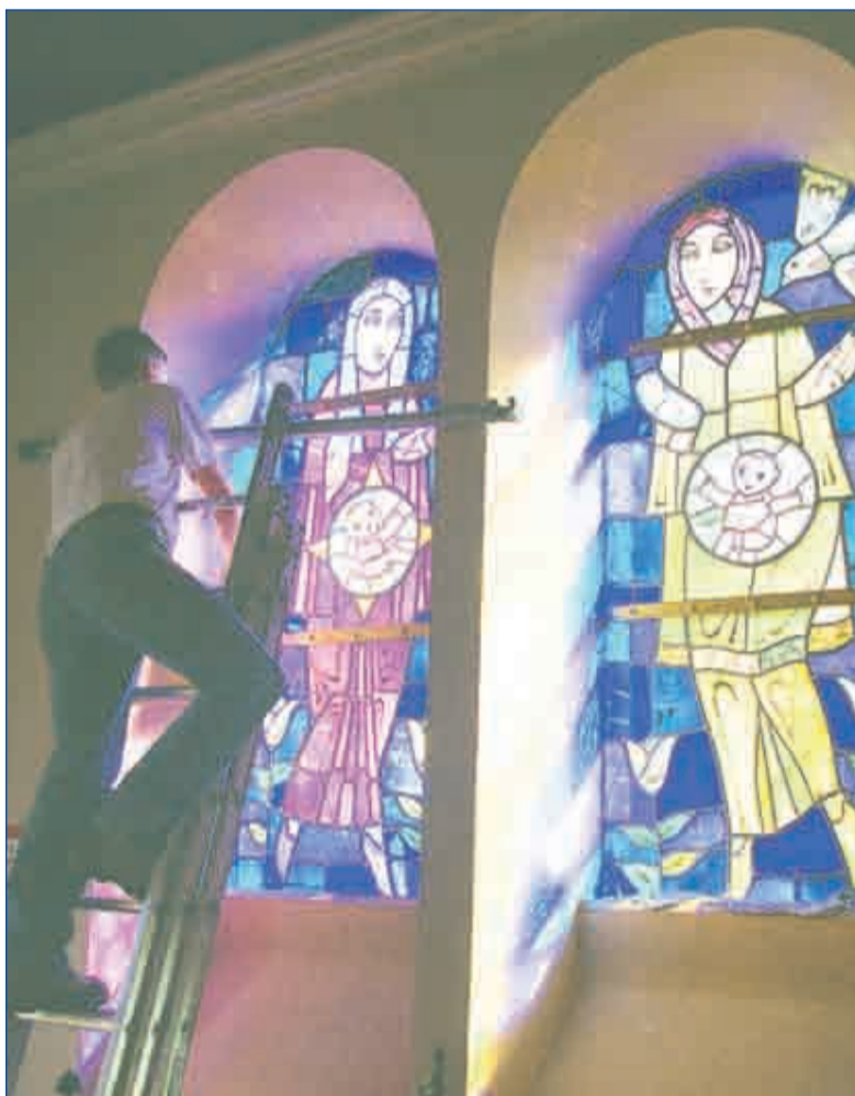
Het plaatsen van twee glas-in-loodramen in Maria- en Elizabethkerk in Rimborg.