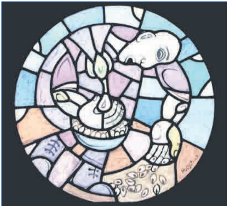
Glas-in-lood van 'De Zaaier'.